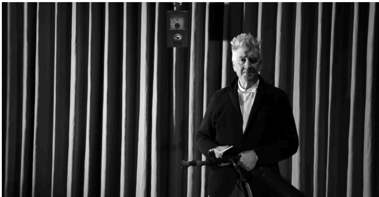
Image extraite du film de présentation de l'exposition "Small Series" à la MEP en janvier 2014

Artiste multimédia (cinéma, design, musique etc.), David Lynch s'attaque pour cette exposition au médium de la photographie à travers ses « petites histoires ». Les photographies, exposées pour la première fois à la Maison Européenne de la Photographie à Paris, présentent quatre thèmes: intérieurs, fenêtres, têtes et natures mortes, se confondant dans l'univers onirique propre à l'artiste. Ces images, surréalistes et imaginaires, retracent l'exploration instinctive de notre subconscient. La préoccupation de Lynch pour le psychisme humain est typique de sa production et le texte d'entrée explicite d'emblée la pensée de l'artiste : « [...] Il est quasiment impossible de ne pas voir une sorte d'histoire émerger d'une image fixe. Et ça, je trouve que c'est un phénomène magnifique. »